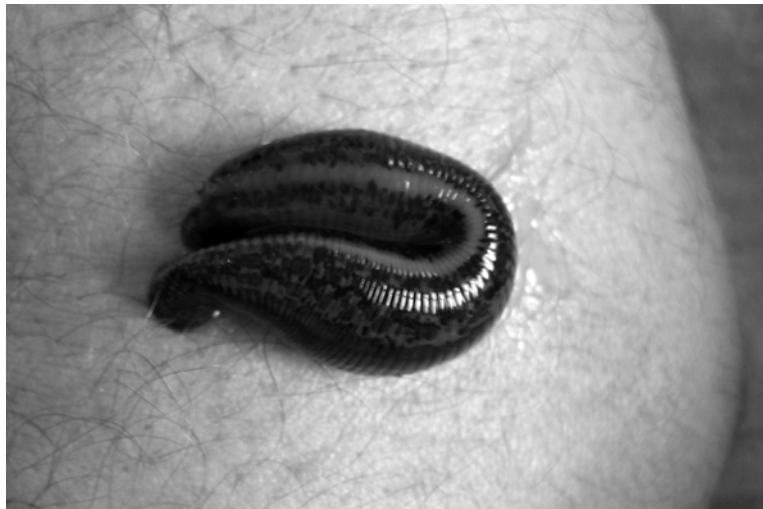
saugender Blutegel am Ellenbogen

Es sollte genügend Flüssigkeit aufgenommen werden.